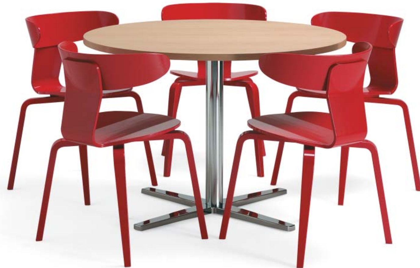
1650 CENTRUM pelarbord / pedestal table / säulentisch 4801 TORSO stol / chair / stuhl