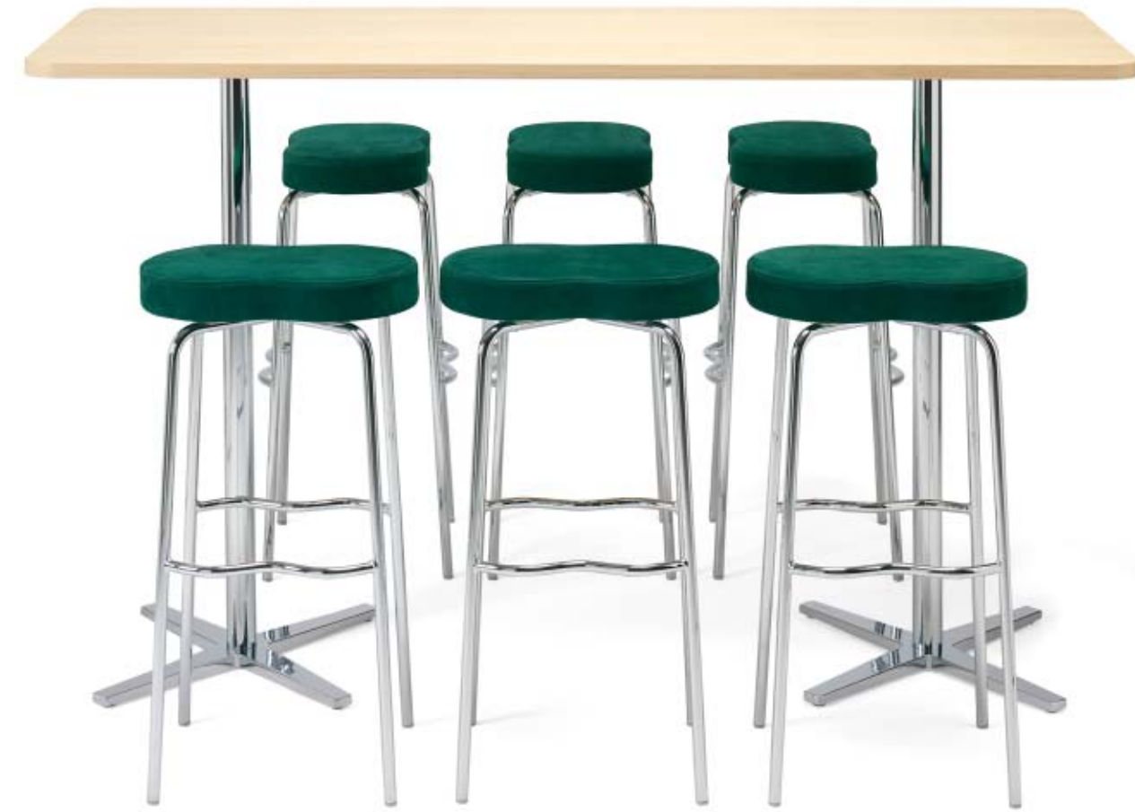
1685 CENTRUM pelarbord / pedestal table / säulentisch 0610 BÖNAN barstol / bar stool / barhocker