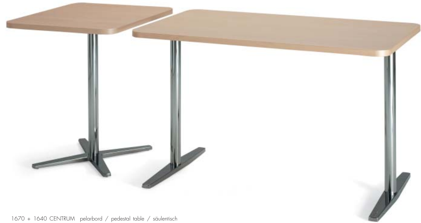
1670 + 1640 CENTRUM pelarbord / pedestal table / säulentisch