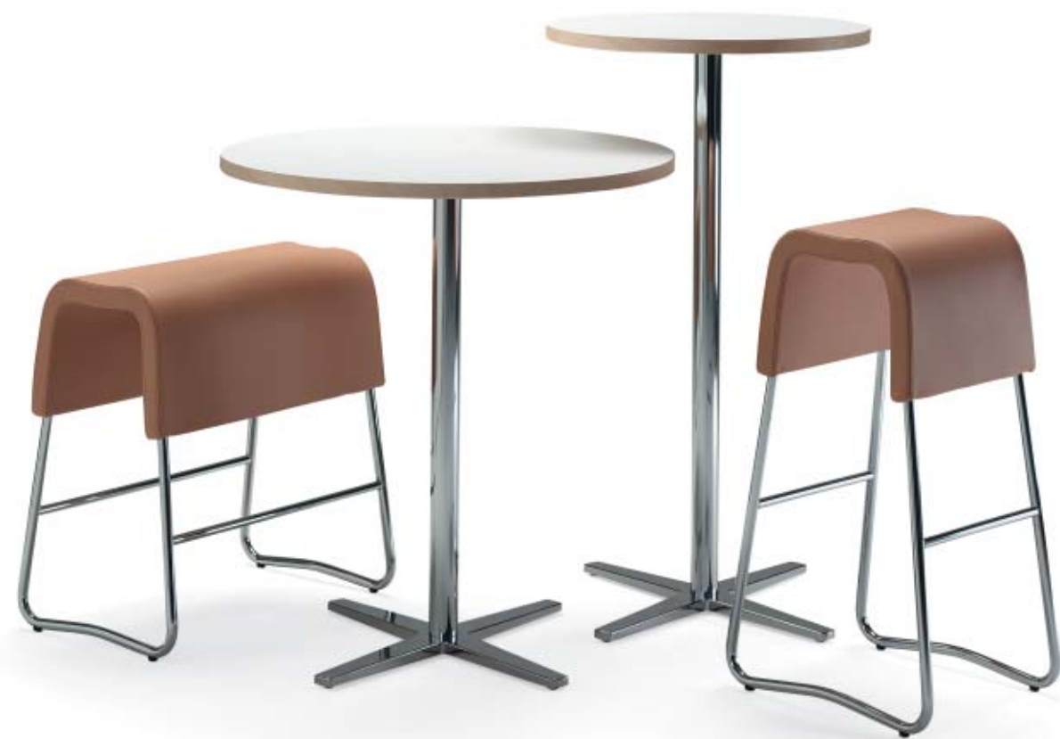
1680 + 1660 CENTRUM pelarbord / pedestal table / säulentisch 0905 PUNT bänk / bench / bank 0910 PUNT barpell / bar stool / barhocker