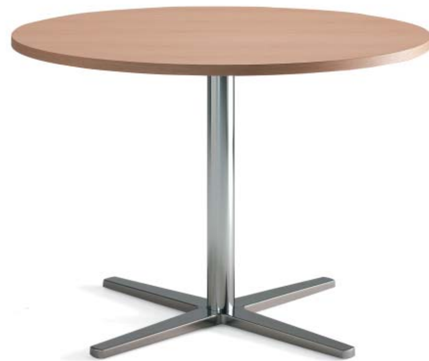
1650 CENTRUM pelarbord / pedestal table / säulentisch