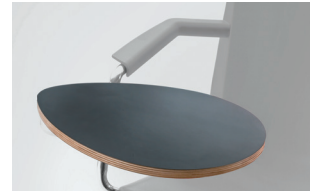
armrest + multilayer tablet bracciolo + tavoletta multistrato