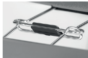
block for alignment links blocco agganci