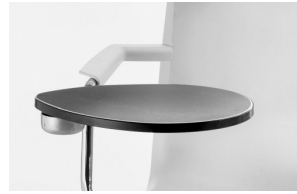
armrest + ABS tablet bracciolo + tavoletta ABS