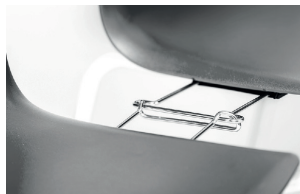
alignment links agganci allineamento