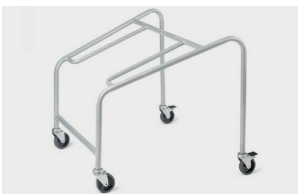
trolley (max 20 pcs) carrello