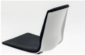
front upholstered shell scocca frontale imbottita