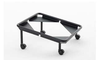
trolley (max 10 pcs) carrello