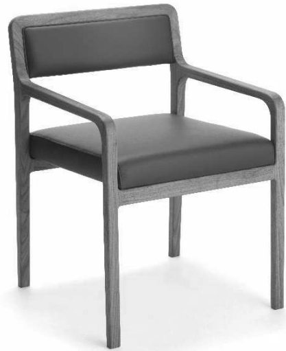
Dimensioni / Sizes (cm) A

Simply elegant. The essential, rounded lines of this armchair make for an unmistakable design, solid yet light, with a distinctive broad seat and elegant legs that create a visual immediacy, emphasising the quality of the materials and production processes. Versatile in the choice of possible settings and uses, they fit seamlessly into a vast range of domestic and collective spaces. Also available in chair, lounge chair and barstool versions.