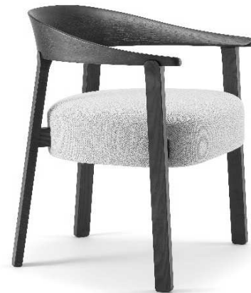
Dimensioni / Sizes (cm) A

Aurea is a chair that goes beyond its function, becoming an integral part of the refined atmosphere of spaces dedicated to hospitality and conviviality. Its wide, handcrafted backrest enhances the natural grain of ash wood, turning each piece into a story of texture and sophisticated details.